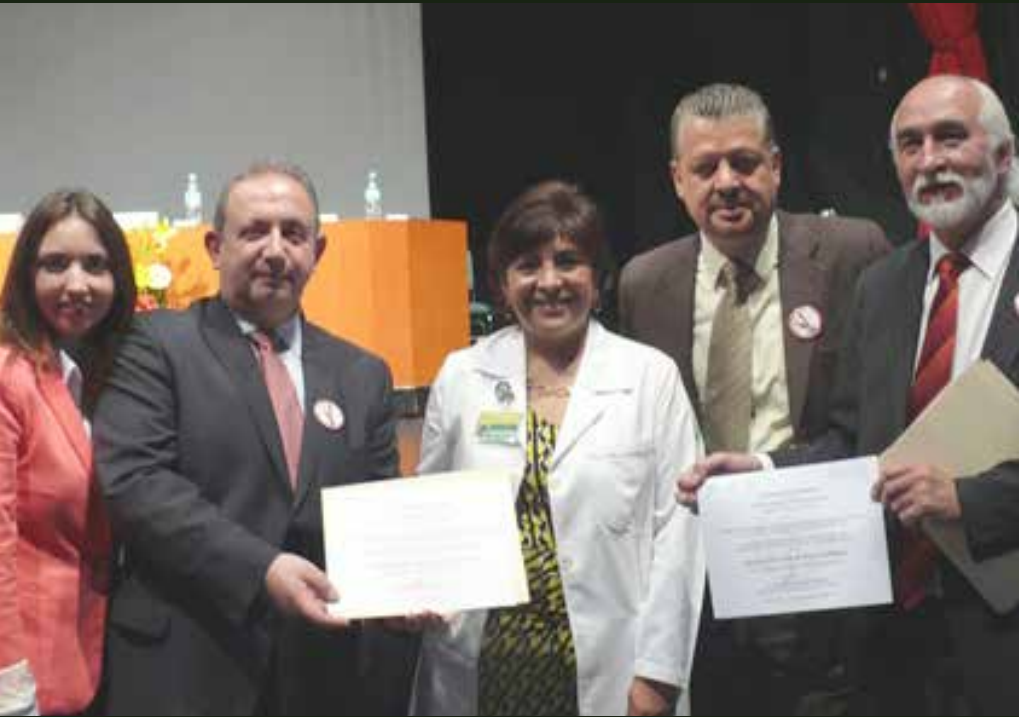
Certificación de instalaciones del SNTSS Libres de Humo de Tabaco. Integrantes del CEN reciben la certificación que reconoce al gremio como un espacio que fomenta el bienestar y la salud de sus agremiados.